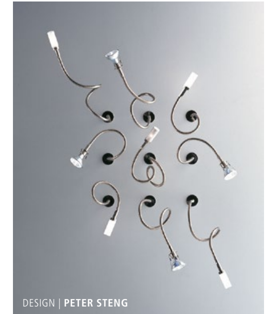
DESIGN | PETER STENG

TOPFLEX LED 12 V | 410 Lm | 7,5 W | 2700 K | CRI 95 Inklusive dimmbarer SORAA Premium Retro-Fit LED Includes a dimmable SORAA Premium Retro-Fit LED