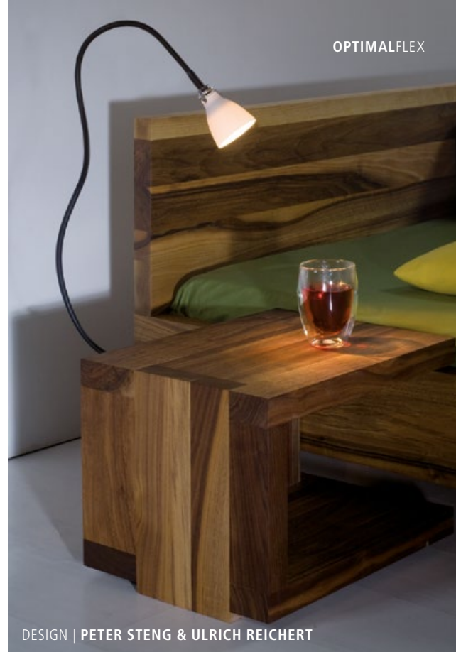
DESIGN | PETER STENG & ULRICH REICHERT

All FLEX versions are equipped with a STENG jack that is adapted to a basic element (pages 100 – 111). Fixed versions without the plug-in connector are available on request for special projects. Lengths over 400 mm are not always suitable for wall installation.