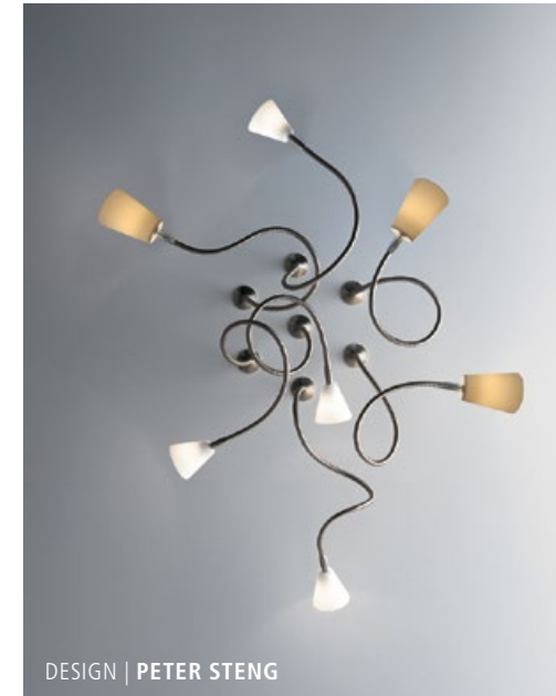
DESIGN | PETER STENG

LED HALO 12 V | max. 35 W | QT-LP9/12 & QR-CBC-35 Ohne Leuchtmittel | Lamp not included